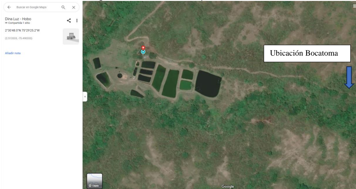
Imagen 2 – Localización Unidad productiva Dina Luz