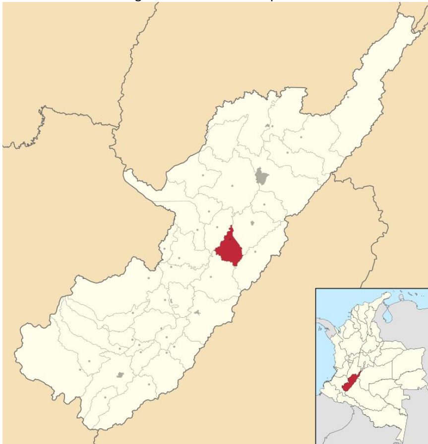
Imagen 1 ubicación municipio Hobo

Construcción de una Bocatoma fondo (Estructura de captación y derivación de Caudal de la quebrada Guasimilla), una bodega y anexos para certificación granja biosegura para abastecer los criaderos Piscícolas de la Unidad Productiva Dina Luz; la Bocatoma de Fondo es una estructura ubicada en el lecho de la fuente perpendicular al sentido de la corriente.